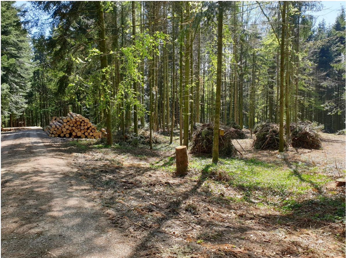
Abbildung 1: Ausgeführter Holzschlag im Grütwald Grosswangen

Beiläufig zur Holzertesaion wurden auch andere Arbeiten ausgeführt, wie zum Beispiel Pflanzungen oder Jungwaldpflege. Im Bereich Biodiversität wurden zwei Waldweiher im Gebiet Graubaum in Sigigen und im Sigerswilerwald in Buttisholz erstellt sowie div. Biodiversitätsprojekte im Gebiet Ämmeberg umgesetzt.