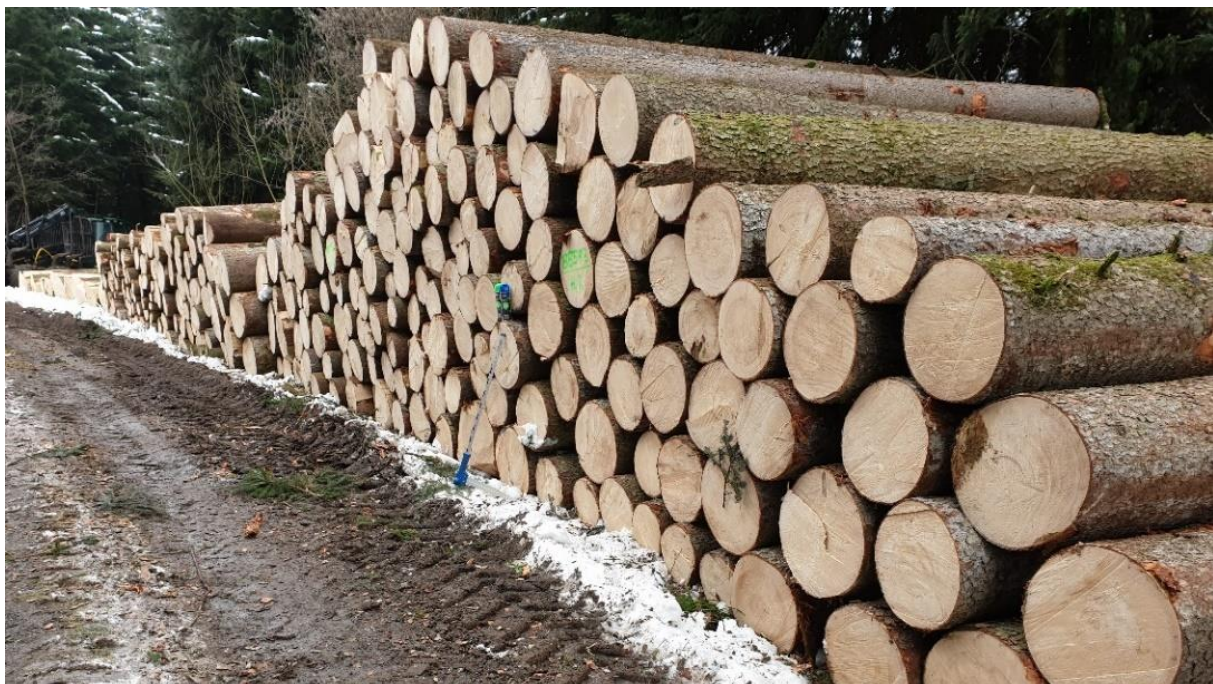
Abbildung 3: Holzpolter im Horütiwald Buttisholz