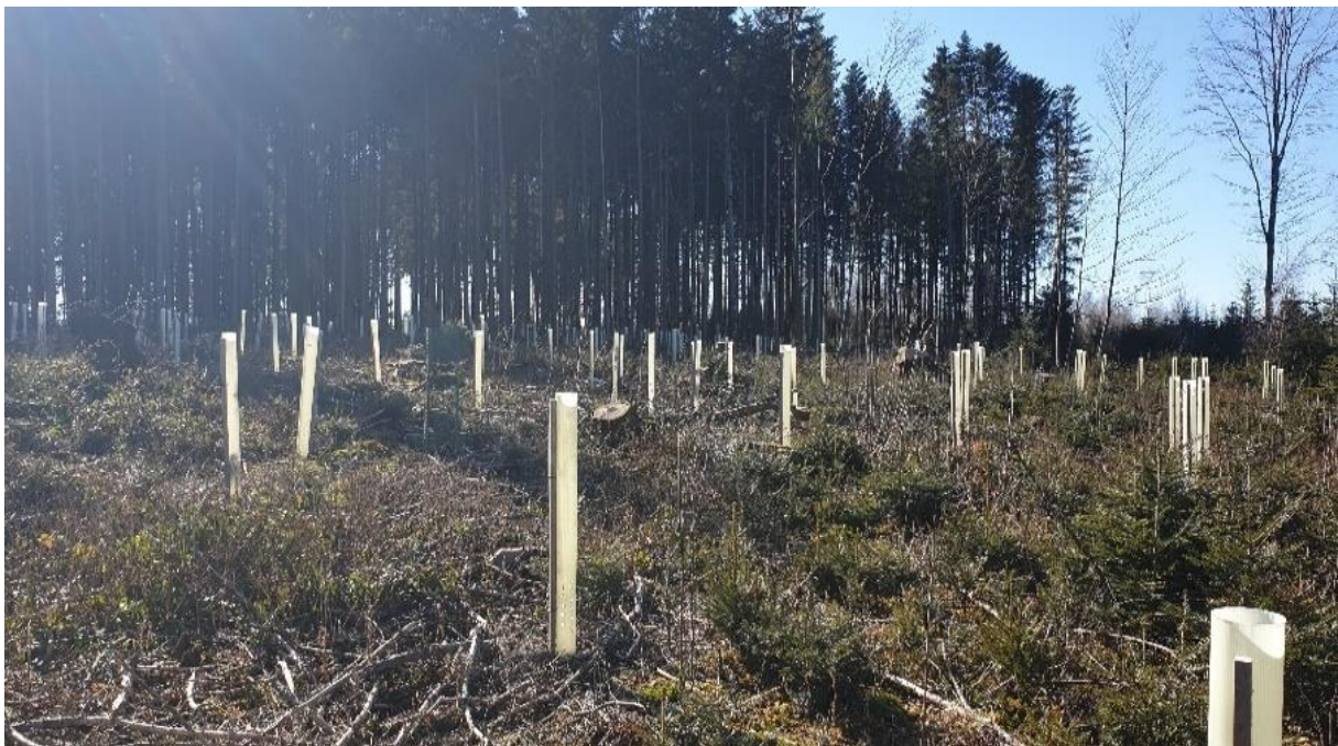
Abbildung 5: SeBa - Pflanzfläche im Gustiberg Buttisholz