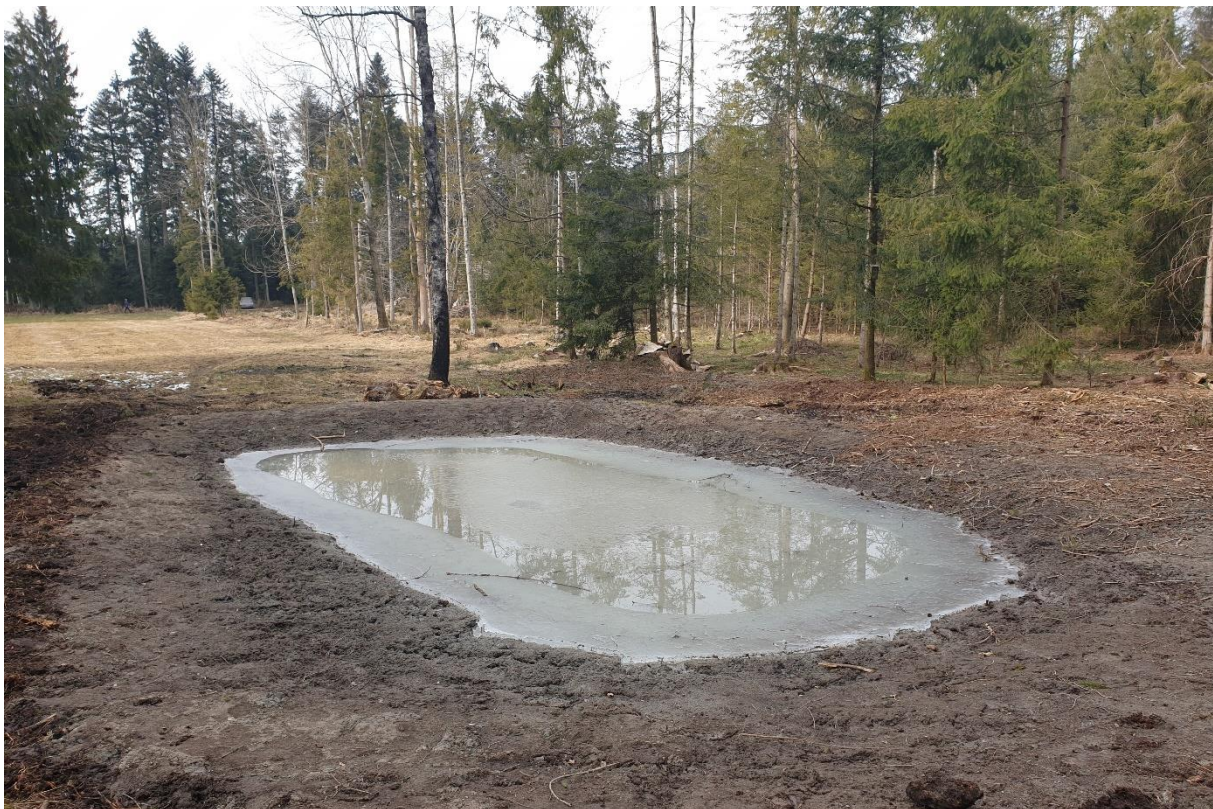
Abbildung 6: Neubau Waldweiher im Graubaummoos Sigigen