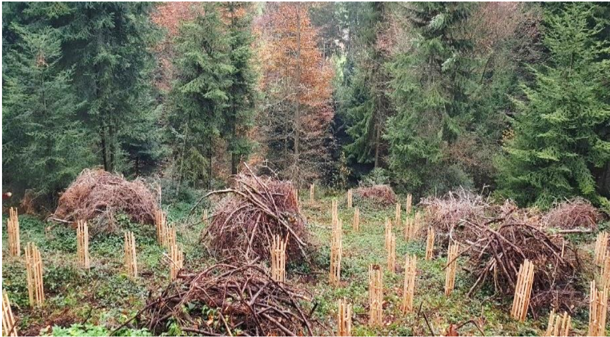
Abbildung 4: Pflanzfläche mit Holzeinzelschützen im Säuräche Grosswangen