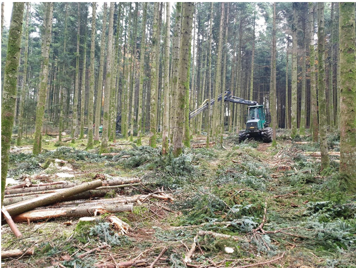
Abbildung 2: Vollmechanisierter Holzschlag im Ettiswilerwald

Die meisten Holzschläge laufen über drei Jahre.