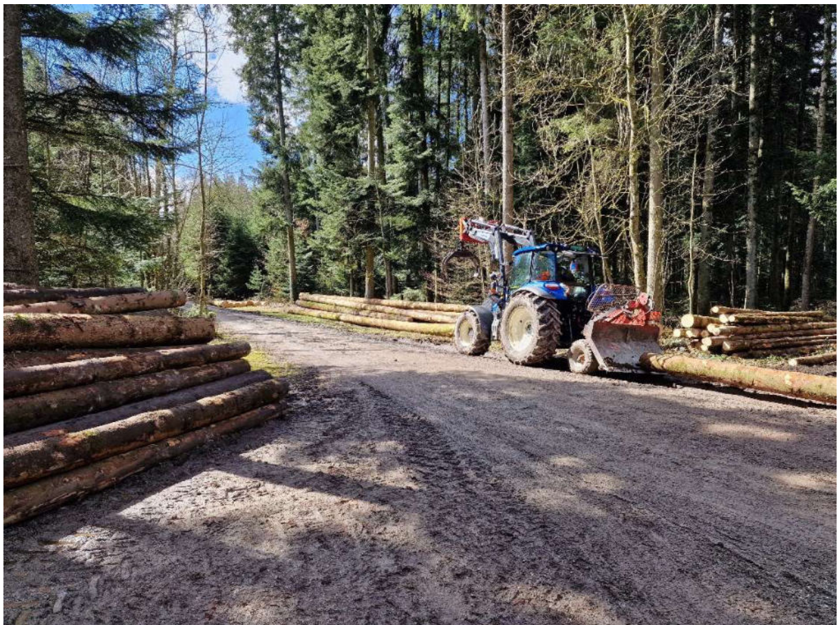
Abbildung 3: Div. Holzpolter beim Grütplatz in Gosswangen