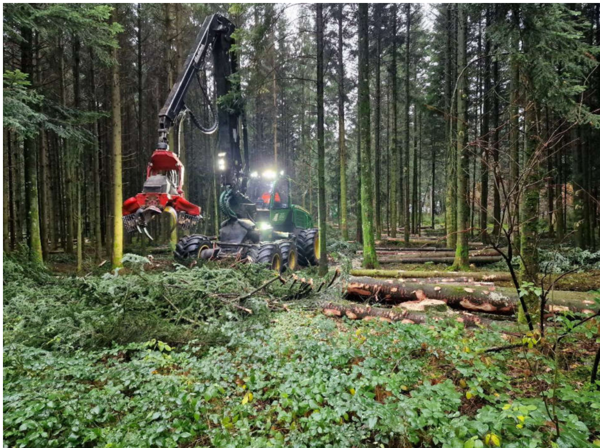
Abbildung 2: Vollmechanisierter Holzschlag im Eierwald Nottwil