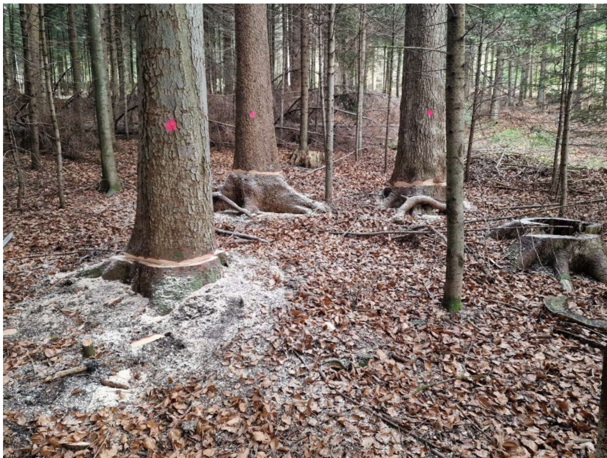
Abbildung 1: Mondholz für eine Bestellung im Stalbebergwald Grosswangen

Im Gebiet Ämmeberg konnten einige Spezialprojekte umgesetzt werden.